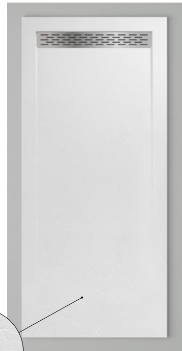
Pizarra texture / Texture Pizarra / Texture Pizarra.